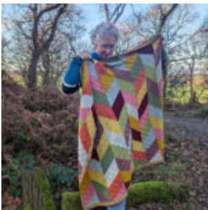
Trapezer og trekanter