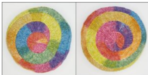
Her er cirklerne brugt som betræk til en rund pude.