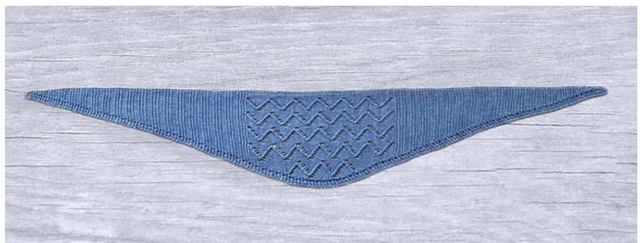
46 cm på bredeste sted i højden