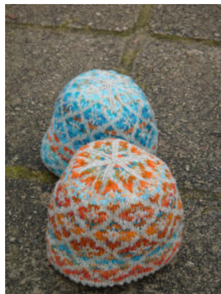
Designeren har lavet disse smukke huer med mønstret fra vesten. Vi har ikke opskriften.