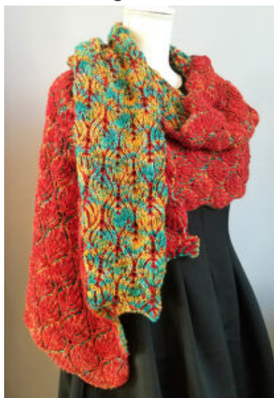
• © Dave-B