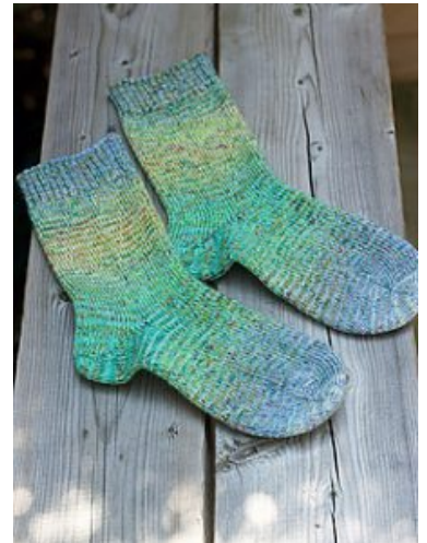
Vendepinde. Strikket i hjemmefarvet garn