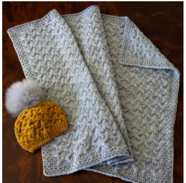
Huen kan købes på Ravelry