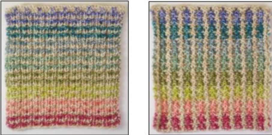
Retside / Vrangside

Den sidste firkant til tæppet var faktisk den første, jeg designede. Den kan bruges på begge sider og ligger fladt.