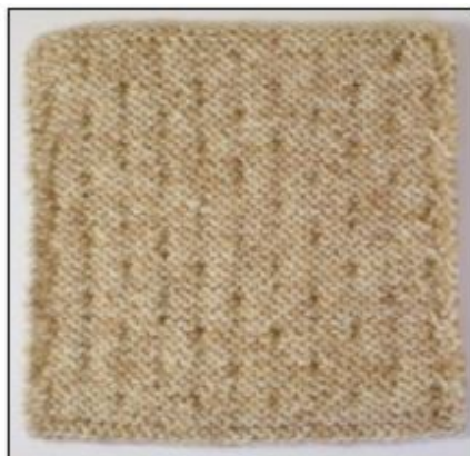
Retside / Vrangside