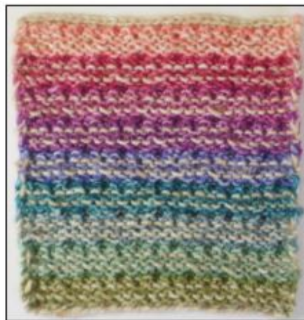
Retside / Vrangsiden

Endnu et dejligt vævestrikmønster, som er baseret på retstriking og derfor ligger fladt. Retsiden er den pæneste.