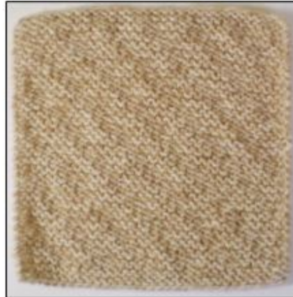
Retside / Vrangside

Denne firkant er meget ligetil. Det er bare ret og vrang, og den er vendbar og ligger fladt.