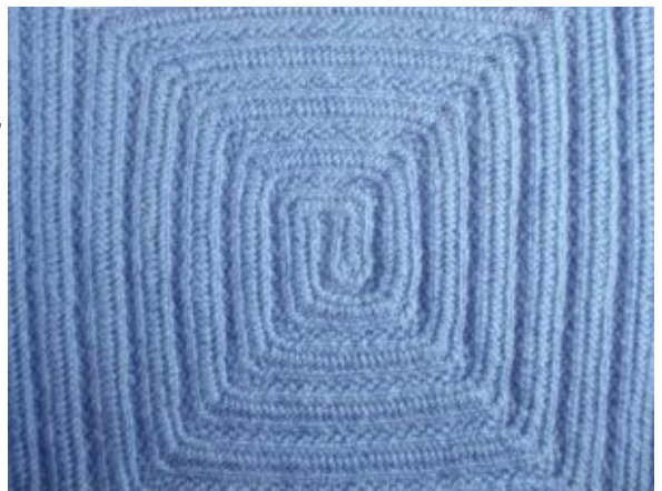
Bagsiden af tæppet